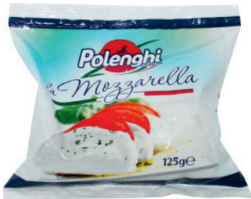
Сир Поленгі Ломбардо Моцарела