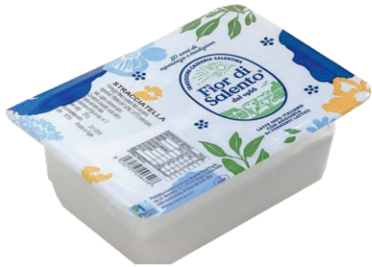
Сир Фіор ді Саленто Бурата, х2