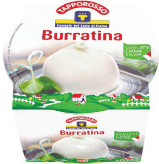
Сир Бурата Таппороссо